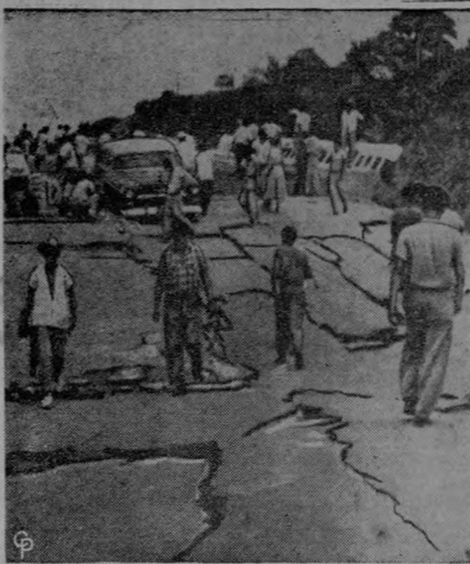
AZOTADO POR EL TERREMOTO. — Varios residentes caminan a través de las grietas en un camino de Jaltipan, México, pueblo que fue azotado violentamente por un terremoto. Siete Estados fueron afectados. En Jaltipan, siete personas murieron y 200 casas fueron destruidas. Informes no oficiales estiman que el número de muertos en toda la zona asciende a 60, con miles de familias desamparadas y sin hogares, y millones de dólares en daños.

La Oficina está distribuyendo más de 2,000 ejemplares de este estudio entre el comercio y el personal de los Estados Unidos, funcionarios de Washington, personalidades comerciales y miembros de la prensa. A cada ejemplar enviado a los funcionarios de Washington, acompaña una carta especial firmada por el presidente de la Oficina, junto con el informe dado a los periódicos y revistas, la Oficina preparó un sumario señalando los datos más importantes de este estudio.