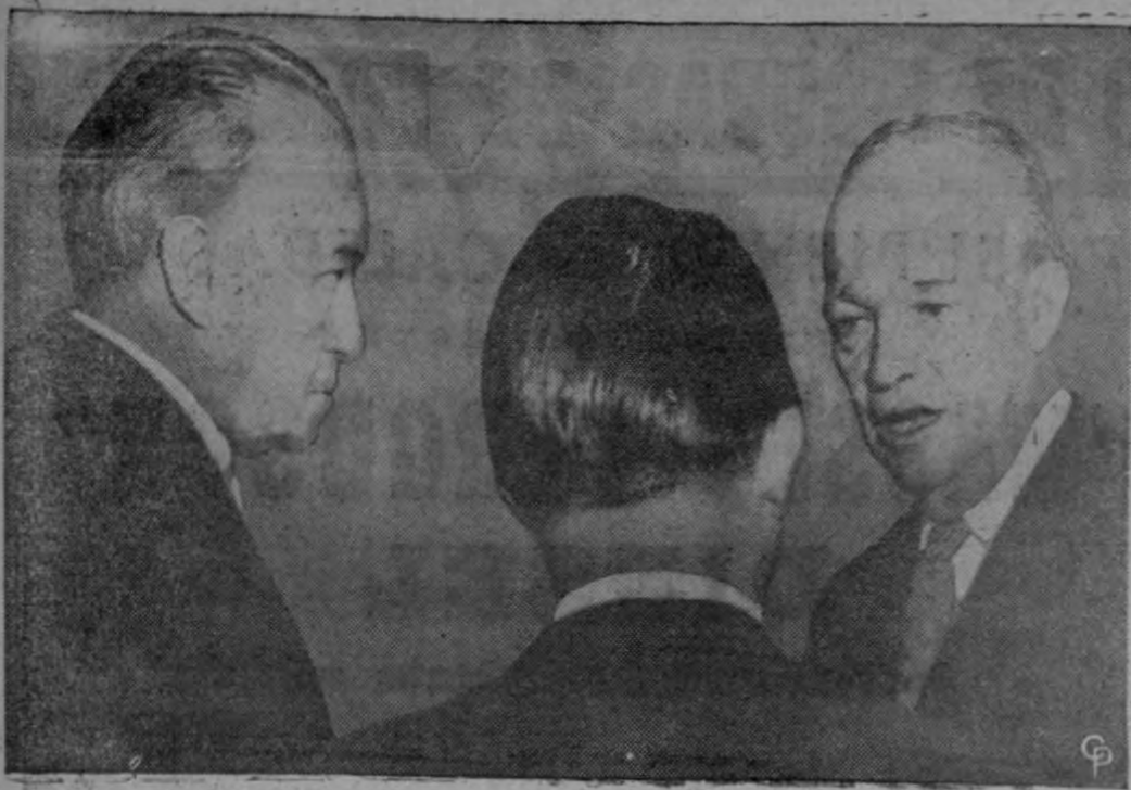
IKE EN BONN. — El Presidente Eisenhower y el Canciller de Alemania Occidental Konrad Adenauer (izquierda) sostienen una discusión sobre la guerra fría, en Bonn. Al centro aparece el intérprete. A Eisenhower se le ofreció un tumultuoso recibimiento en la capital de Alemania Occidental. Después de una conferencia de dos horas, el Presidente se marchó rumbo a Londres, donde se entrevistará con el Primer Ministro de Gran Bretaña Harold MacMillan.