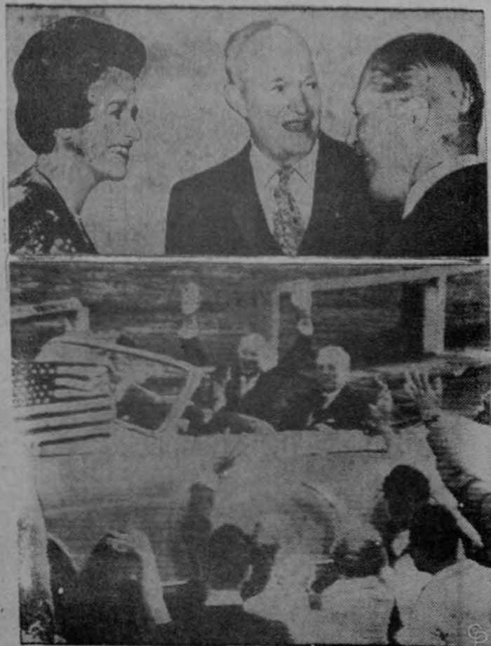
IKE RECIBE UNA OVACION EN LONDRES. — La esposa de John Hay Whitney, embajador de los Estados Unidos, aparece en la foto con el Presidente Eisenhower y el Primer Ministro británico Harold MacMillan en la residencia del Embajador, en Londres. Abajo, el Presidente Eisenhower reconoce la ovación de los miles de londinenses. Sentado junto a él aparece el Primer Ministro MacMillan.

Teléfono: 4257 — San José — Apartado: 1990